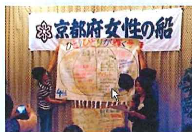
内容はもちろん、限られた時間でのプレゼンテーション能力も必要となります。