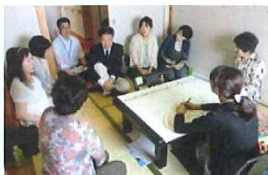
山下副知事加わり、議論は白熱！