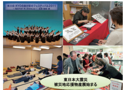
第23回「～私たちが今できること～生命・地域 絆」