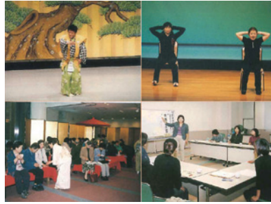
第16回「ともに響きあおう夢への第一歩」