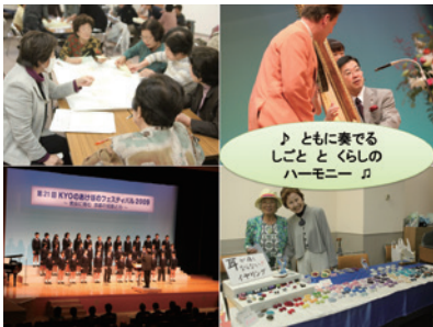
第21回「男女に育む 京都の知恵と力」