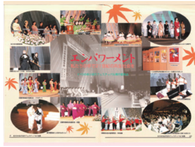
第7回「ささえあい、たかめあう、豊かな共生社会の創造」