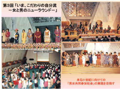
第3回「いま、こだわりの自分流一女と男のニューラウンダー」