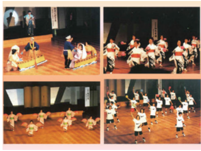
第6回「個の共生のびやかな男女共同参画時代をめざして」