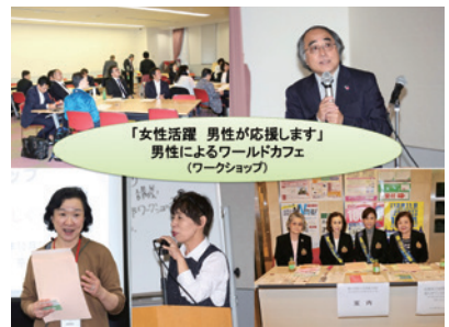
第29回「共生の文化 互いに支え合い 未来につなぐ」

平成30年10月20日 第30回「女性がつなぐ文化と伝統 新しい京都に」みなさまのおかげで、今年30周年を迎えることができました。