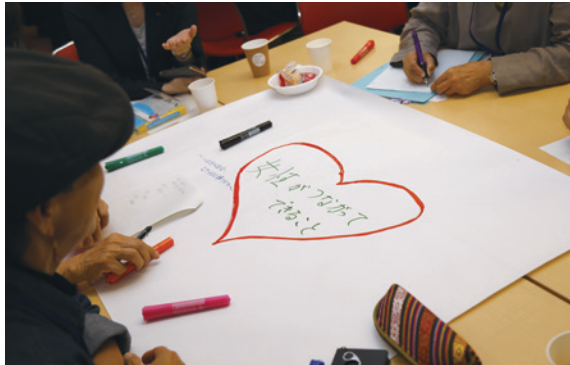
[第2部] 地域会議を体験してみよう