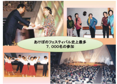
第5回「明日をひらく女と男のフロンティア」