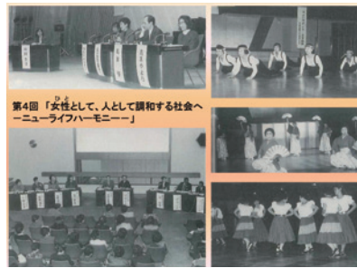
第4回「女性として、人として調和する社会へニューライフハーモニー」