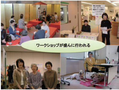
第18回「男女で紡ぐ地域のきずな 京都の未来」