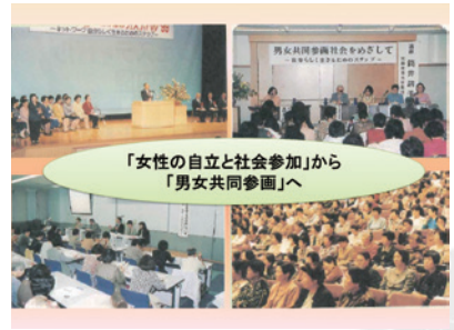
第11回「ネットワーク自分らしく生きるためのステップ」