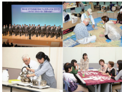
第25回「つなげたいあなたの思い 未来の京都へ」