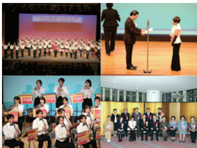
第27回「大交際時代!あらゆる世代の知恵と力で京都創生」