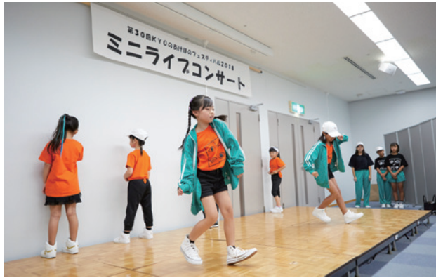
「元気いっぱいの子どもたちによるHip Hopダンス」 choreographer KAORI