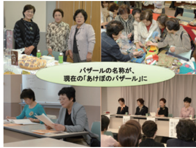
第19回「地域の力で育む生命」