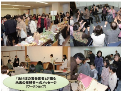
第24回「希望の未来—主役はあなた・私—」