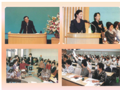
第12回「地域から地球へ～あなたの行動で21世紀を創ろう～」