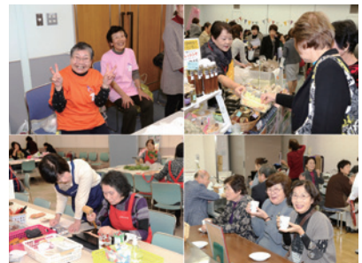
第26回「私から未来へ発信!次世代へつなぐ明日の京都」