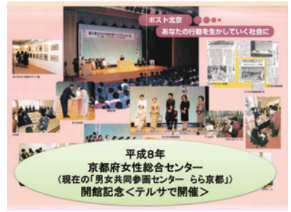
第8回「ポスト北京・あなたの行動を活かしていく社会に」