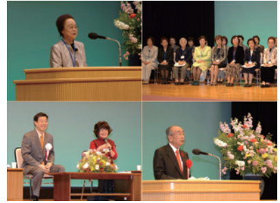
第17回「男女・元気宣言～Let's チャレンジ～」