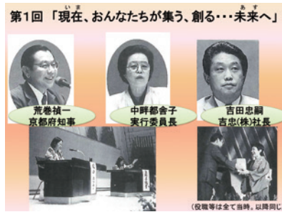
第1回「いま、おんなたちが集う、創る…未来へ」