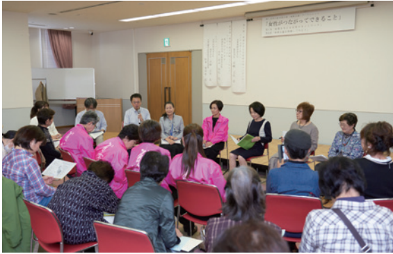
[第1部] 地域を支える女性のネットワーク