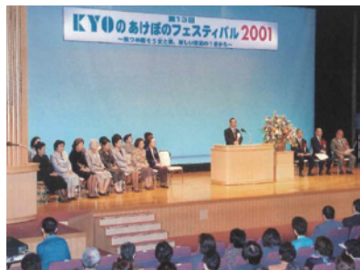
第13回「見つめ直そう女と男 新しい世紀の1歩から」