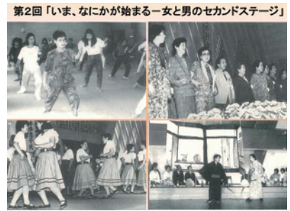
第2回「いま、なにかが始まる一女と男のセカンドステージ」