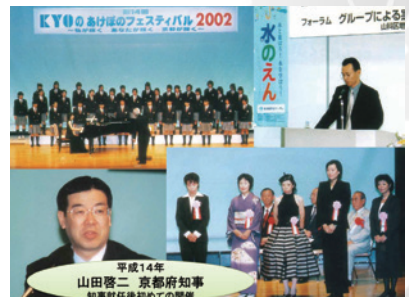
第14回「私が輝くあなたが輝く 京都が輝く」