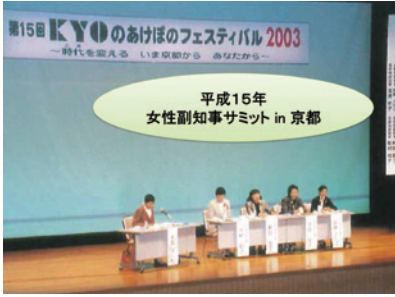
第15回「時代を変えるいま京都から あなたから」