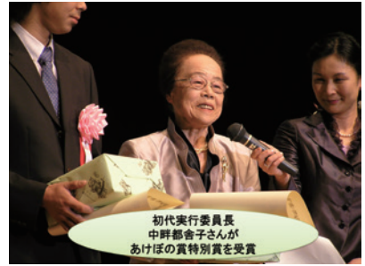
第20回「平安から未来へともに輝くワーク・ライフ・バランス」