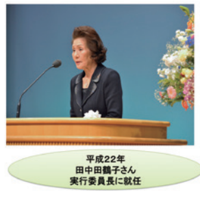
第22回「響き合い 地域・いのち つなげる未来」