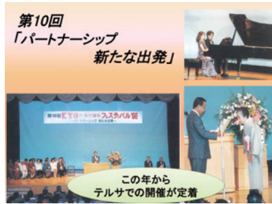
第10回「パートナーシップ新たな出発」