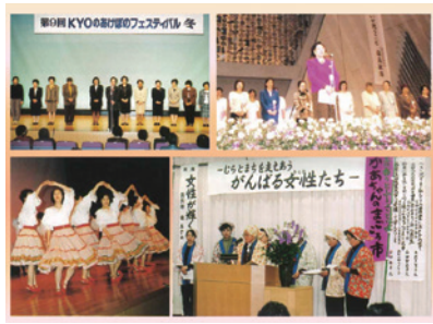
第9回「環境とわたしたち」