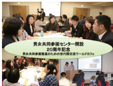
第28回「文化創生 皆で織りなす京の力」